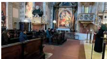
Sa. 17. Feb.: Führung durch das Stift mit Abt Nikolaus

Anschließend findet eine Agape im Pfarrgarten mit den Pfadfindern statt!